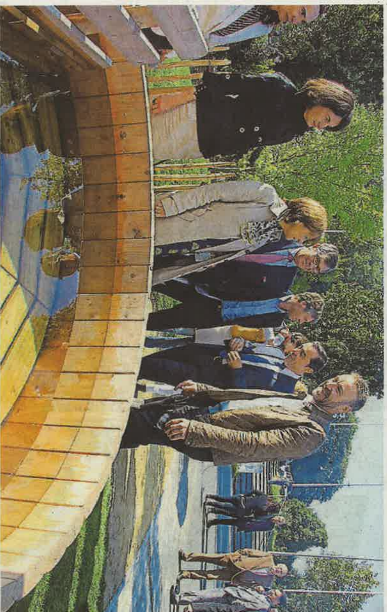
Aménagements extérieurs comme ce bain finlandais.