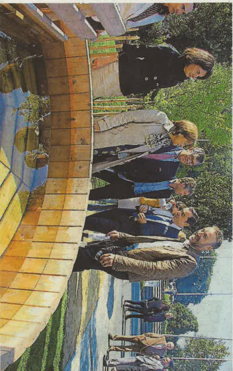
Aménagements extérieurs comme ce bain finlandais.